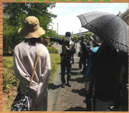
気になる草木のものがたり