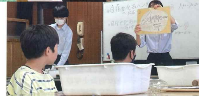
「ならしのリーダーズ」