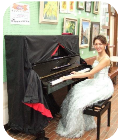
～次はあなたの番です～

実花公民館ロビーに、自由に弾けるピアノが登場しました! 開放時間:10時～18時(予約不要) 窓口で受付してからご利用ください。 一人当たり15分が目安です。 未就学児は保護者同伴で。 詳細については、HPをご覧ください。