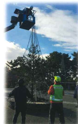
もみの木に電飾装飾